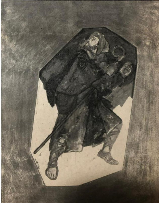
Figuur 3 - «De pelgrim», schilderij.

Hij had er heel zijn leven van gedroomd en er naar verlangd.