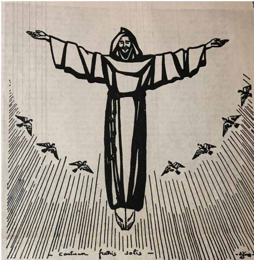
Figuur 7 - «Sint Franciscus en de vogels», tekening.