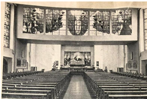
Figuur 2 - Glasramen van Yoors in de kapel van de Boodschap, H. Hartinstituut, Heverlee (2).