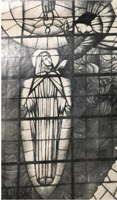
Figuur 4 - Fragment van het glasraam «De Boodschap», in dezelfde kapel te Heverlee.