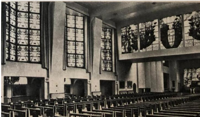
Figuur 1 - Glasramen van Yoors in de kapel van de Boodschap, H. Hartinstituut, Heverlee (1).