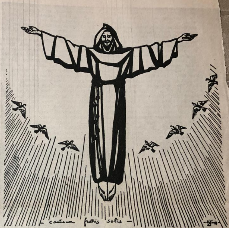
«Sint Franciscus en de vogels», tekening.