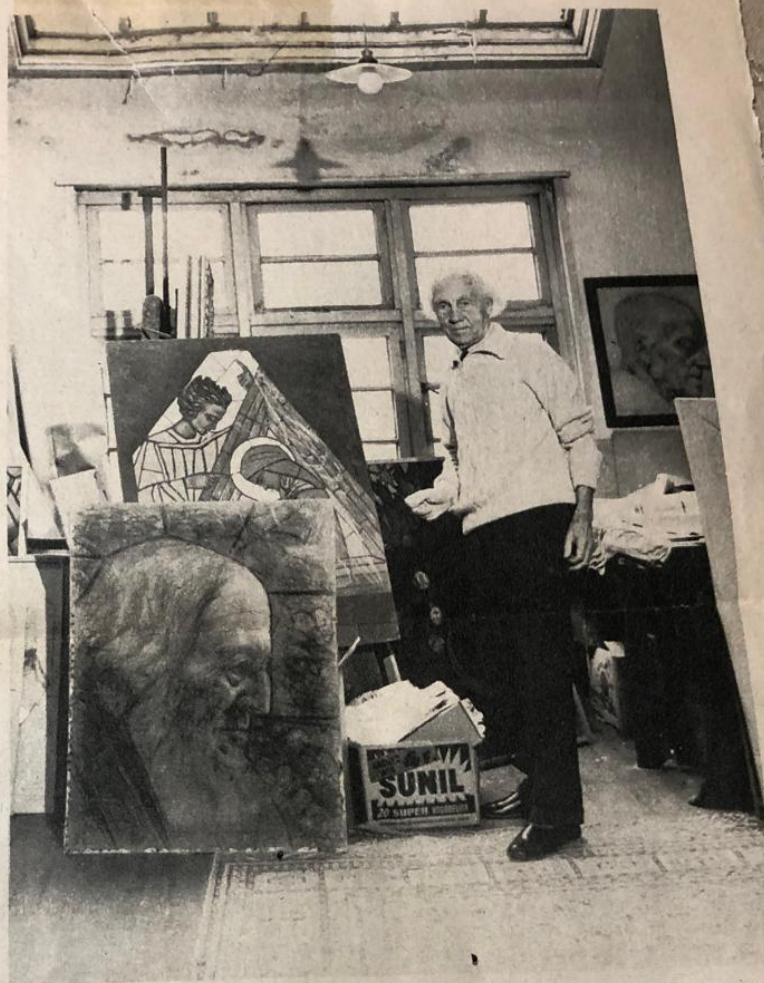
Eugeen Yoors in zijn atelier.

Ik voel mij niet bekwaam en nog minder bevoegd om verantwoord-kritische beschouwingen te maken rond het werk van Eugeen Yoors. Dat hebben anderen, met kennis van zaken, gedaan tijdens zijn leven en ook na zijn dood (1). En hopelijk zal in de toekomst over hem het laatste woord nog niet geschreven zijn. Ik wou alleen maar even rustig terugdenken aan de edele mens en eminente kunstenaar, die mij zo vaak en zo sterk door zijn werk heeft aangesproken, ontroerd en verrijkt; en die mij de onschatbare weelde gunde, tijdens de laatste 25 jaren van zijn leven zijn vriend te zijn. Het is een van Gods grote genaden in mijn leven.