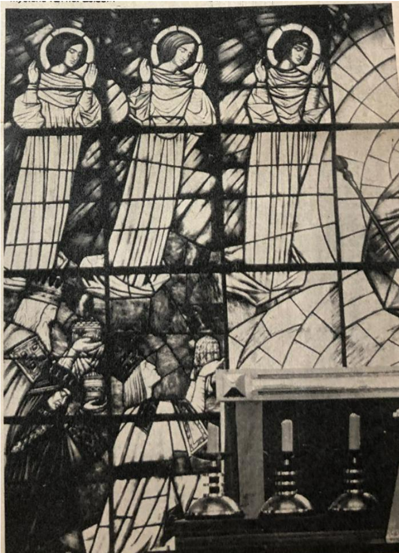
Figuur 6 - «De aanbidding», glasraam in het klooster der zusters Annonciaden, te Heverlee.

Wie de glasramen van Eugeen Yoors niet heeft gezien en beleefd, mist enkele kostbare stenen uit het mozaïek van Vlaanderens religieus kunstpatrimonium !