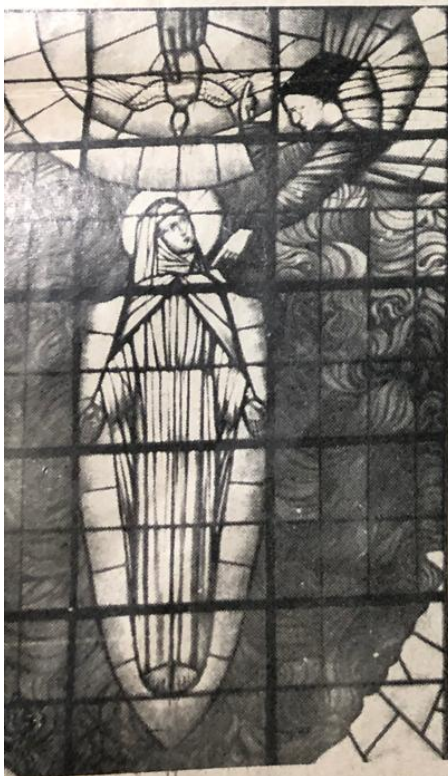
Fragment van het glasraam «De Boodschap», in dezelfde kapel te Heverlee.